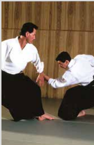
AIKIDO : les cours sont dispensés chaque mercredi de 12h à 14 h au petit dojo.