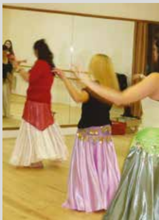
DANSE ORIENTALE : cours chaque samedi à l'EVASION de 13h30 à 15h. Inscriptions : Tout au long de l'année sur les lieux et aux heures des cours. Contact ☎ 01 46 87 98 58 www.amar-sports.com