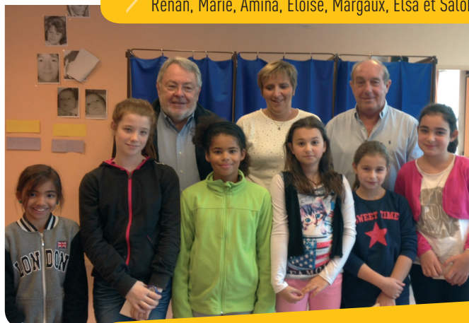
➤ Elus aux Antes :