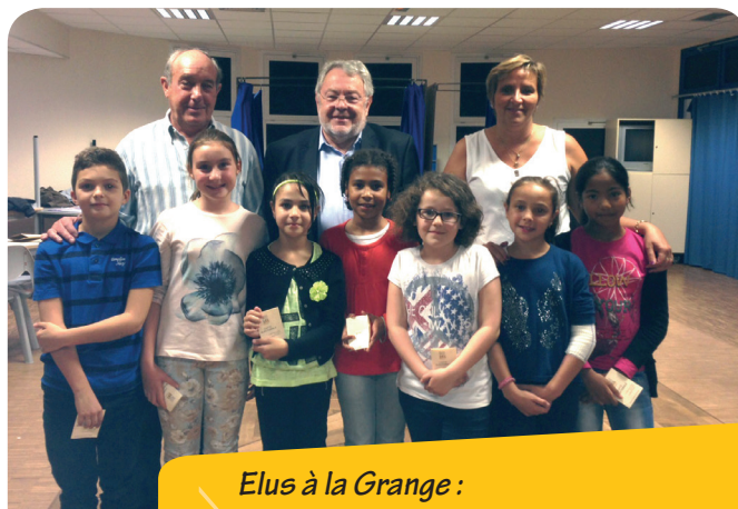
➤ Elus à la Grange :