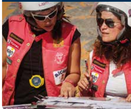
Le goût de l'extrême !