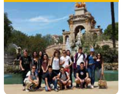
Séjour à Barcelone pour l'Espace Jeunes