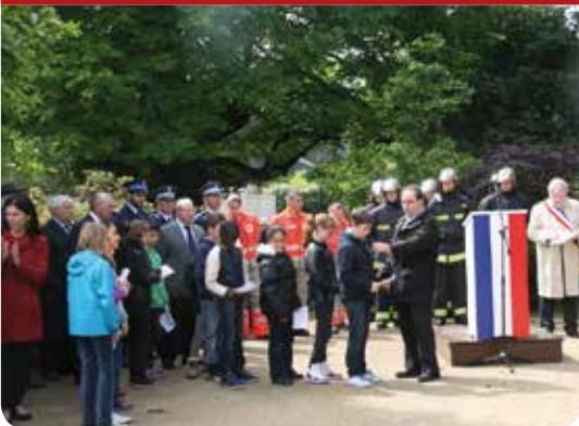
Passeurs de mémoire...