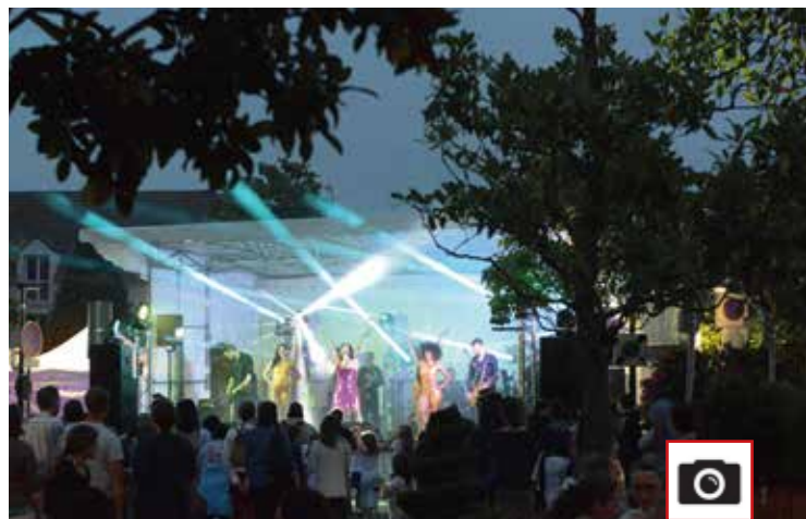
Soirée place Louis XIII avec les danseuses des années 80 !

Que tous soient ici amplement remerciés !