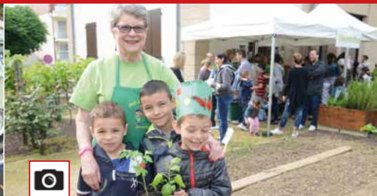
La journée portes ouvertes du jardin pédagogique