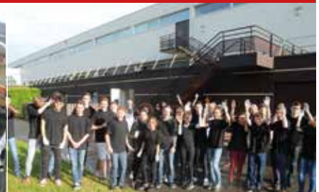
Le Barbecue et la retraite aux flambeaux