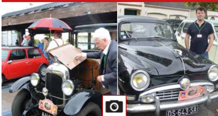
Défilé de voitures anciennes...