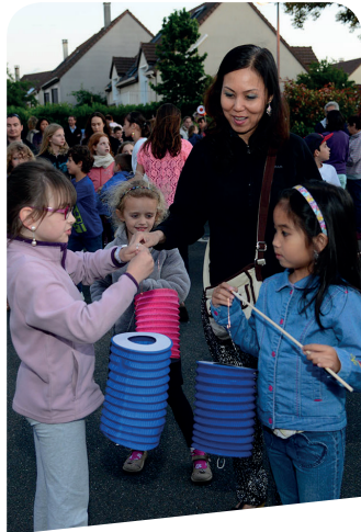
> La retraite aux flambeaux