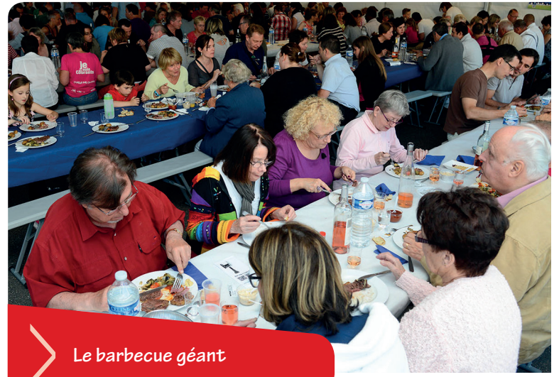
> Le barbecue géant