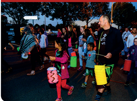
Fêtes de l'été