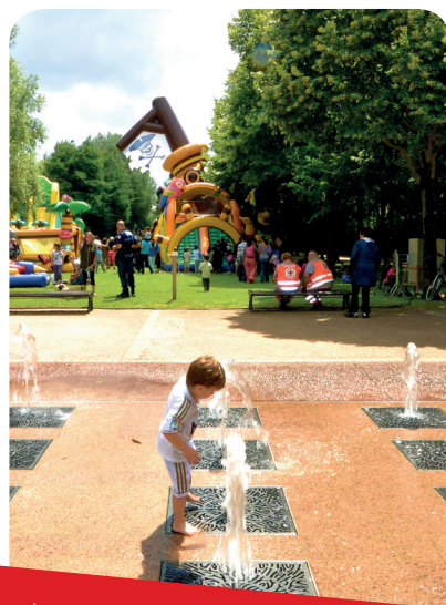
Les jeux pour les enfants