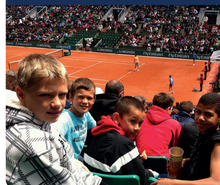
CISL à Roland Garros