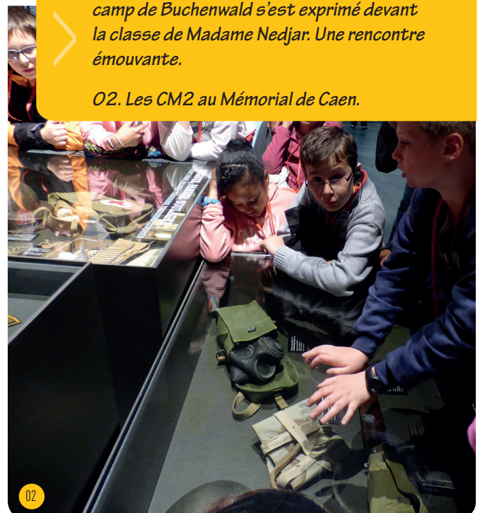
02. Les CM2 au Mémorial de Caen.

Au moment où le journal était en impression, les moyens et les grands de l'école maternelle Médicis ont chanté pour les résidents de l'EHPAD le jeudi 26 juin. Une amorce au travail d'échanges intergénérationnels qui débutera l'an prochain, travail dans le cadre du projet de l'école.