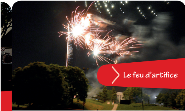
> Le feu d'artifice