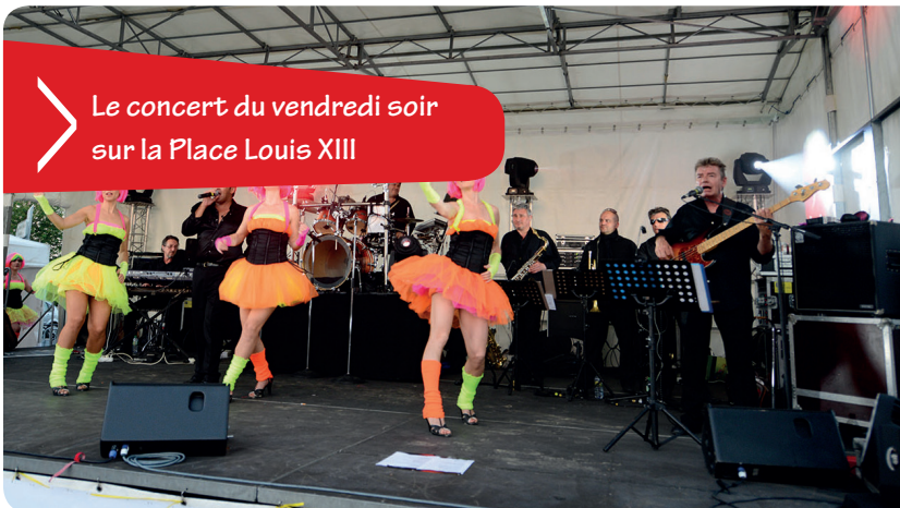
Le concert du vendredi soir sur la Place Louis XIII

Les fêtes de l'été à Rungis ce sont de nombreuses manifestations organisées par les associations et notamment un week-end temps fort animé par le Comité des fêtes.