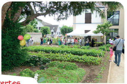
> La journée portes ouvertes du jardin pédagogique