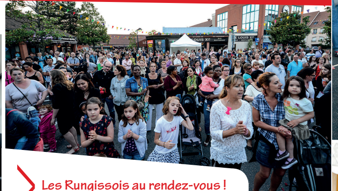
Les Rungissois au rendez-vous !