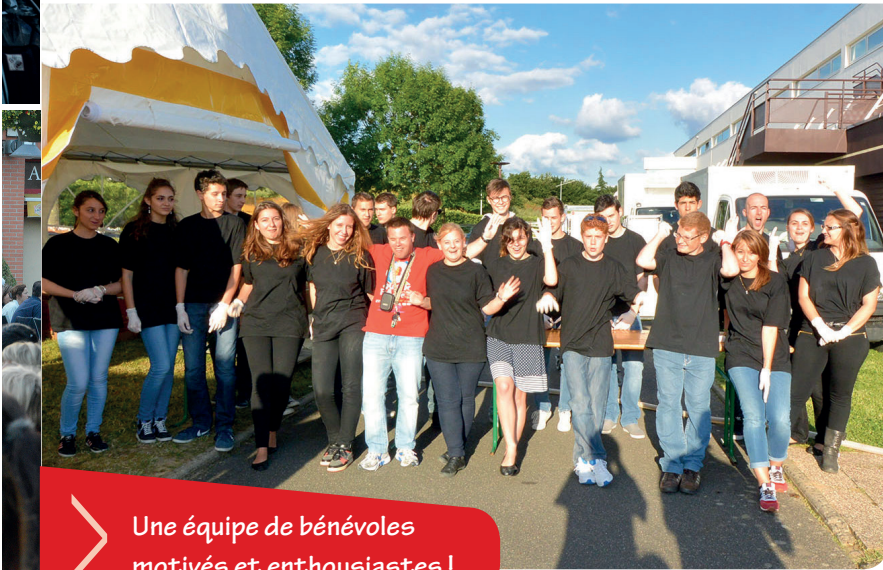
> Une équipe de bénévoles motivés et enthousiastes !