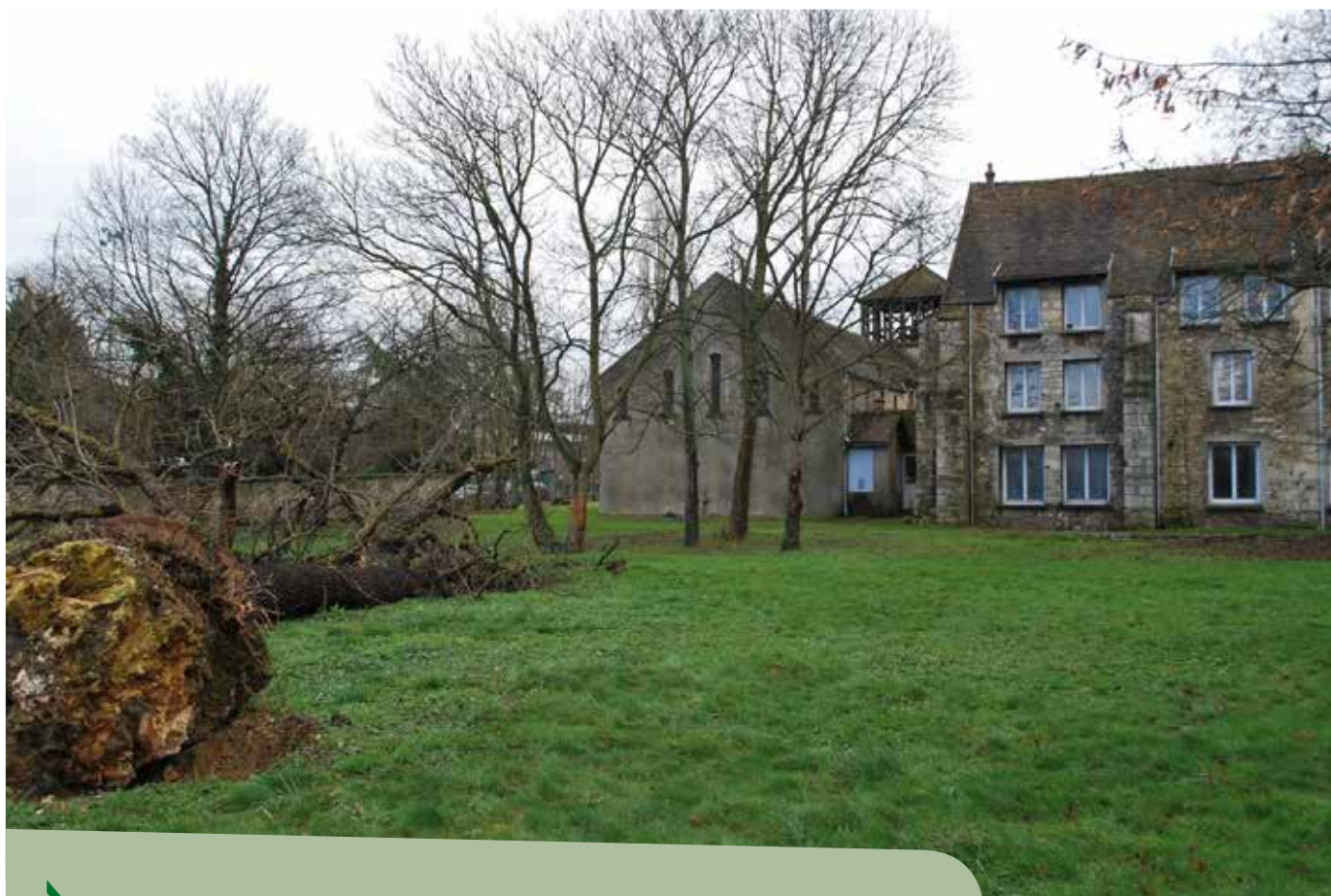
Vue arrière du parc de l'ancien prieuré St-Grégoire, ancienne ferme du Chapitre Notre-Dame

> Nous rendrons compte dans un prochain journal des résultats éventuels de ce diagnostic.