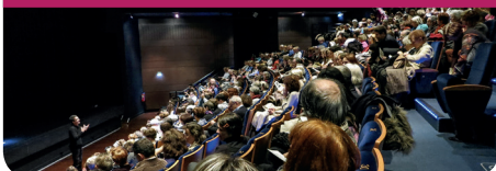
Succès au Théâtre