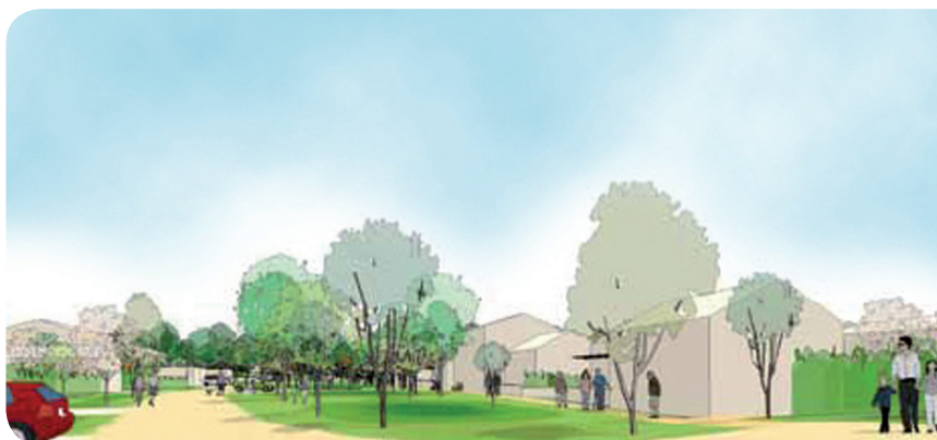
Dessin non contractuel

Depuis plusieurs mois le maire et les élus ont fait valoir dans les journaux municipaux, les raisons pour lesquelles ils ne voulaient pas des 2 000 logements sur la Plaine. Le besoin de logement existe sur Rungis ! C'est un fait. Mais il ne doit pas dépasser les 400 logements sur la plaine. 400 logements harmonieusement construits en limite de Rungis, dans un « quartier village » en lien avec le quartier des Antes, au sud de la rue de Fresnes. ■