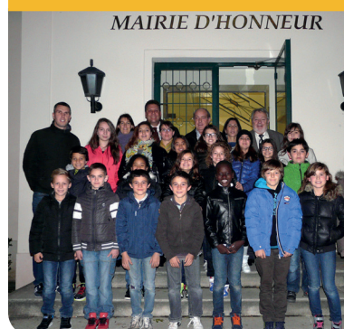
Séance plénière du CME