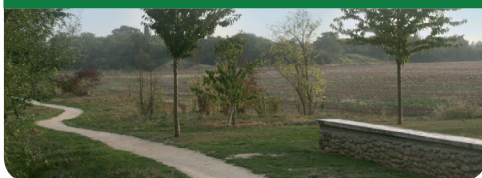
Les allées de Monjean