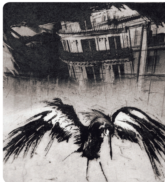
* chlorpyrifos : (du grec) Nom d'un pesticide à l'origine de la migration, à Paris notamment, de nombreux oiseaux fuyant les zones rurales périphériques.