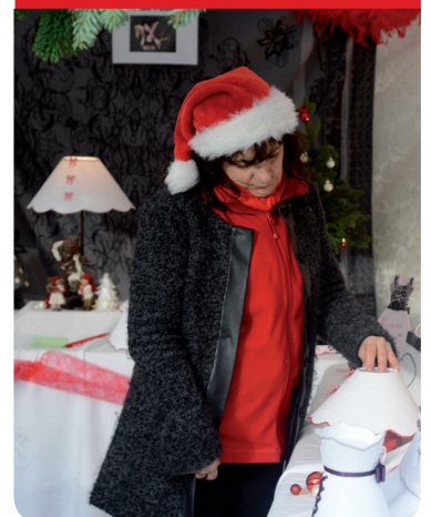
Le marché de Noël