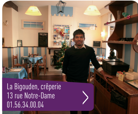
La Bigouden, crêperie 13 rue Notre-Dame 01.56.34.00.04