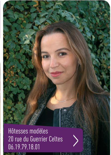
Hôtesse modèles 20 rue du Guerrier Celtes 06.19.79.18.01