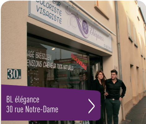
BL élégance 30 rue Notre-Dame

Ancien commerce « relooké », entreprise nouvellement installée, auto-entrepreneurs, artisans ou professions libérales, nous saluons dans ces pages l'initiative de leur chef d'entreprise à avoir choisi Rungis. Chaque Rungissois, en allant les rencontrer ou en faisant appel à leurs services, pourra ensuite se faire sa propre idée. C'est important de soutenir le commerce et les activités locales !