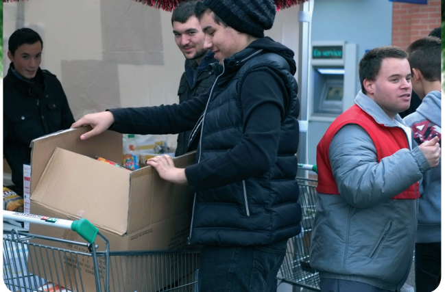
Des jeunes solidaires !