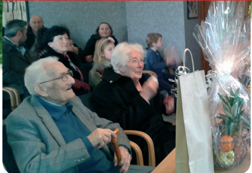
Deux centenaires rungissois à l'honneur !