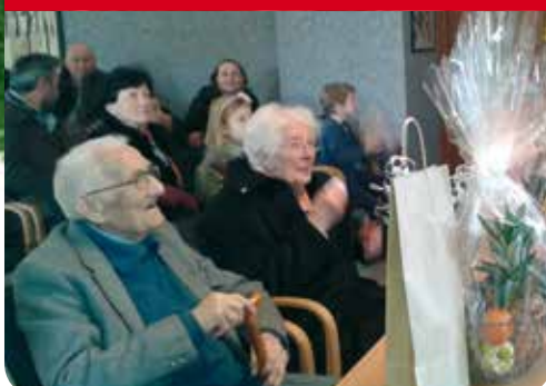
Deux centenaires rungissois à l'honneur !