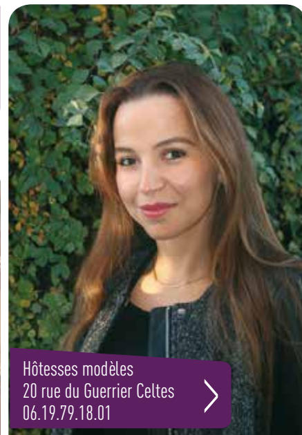
Hôtesse modèles 20 rue du Guerrier Celtes 06.19.79.18.01