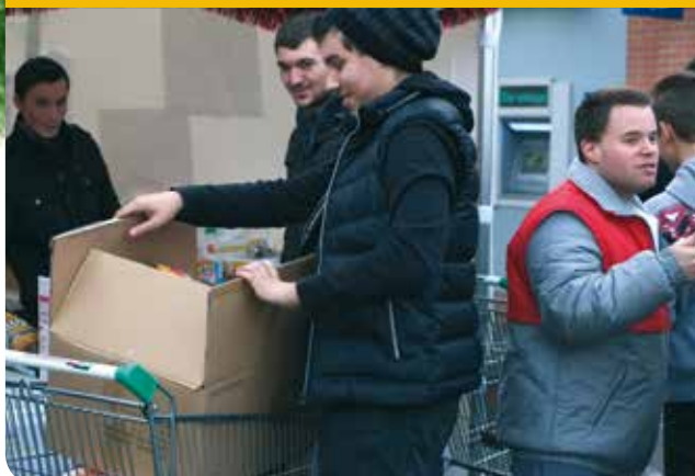
Des jeunes solidaires !