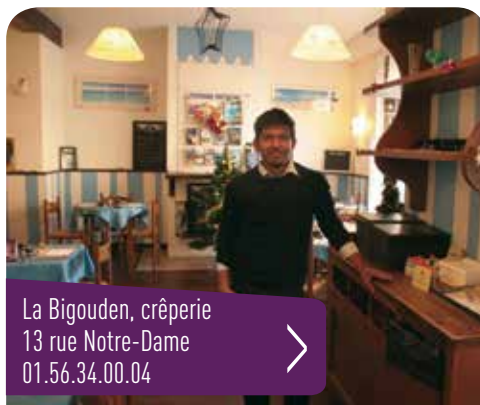
La Bigouden, crêperie 13 rue Notre-Dame 01.56.34.00.04