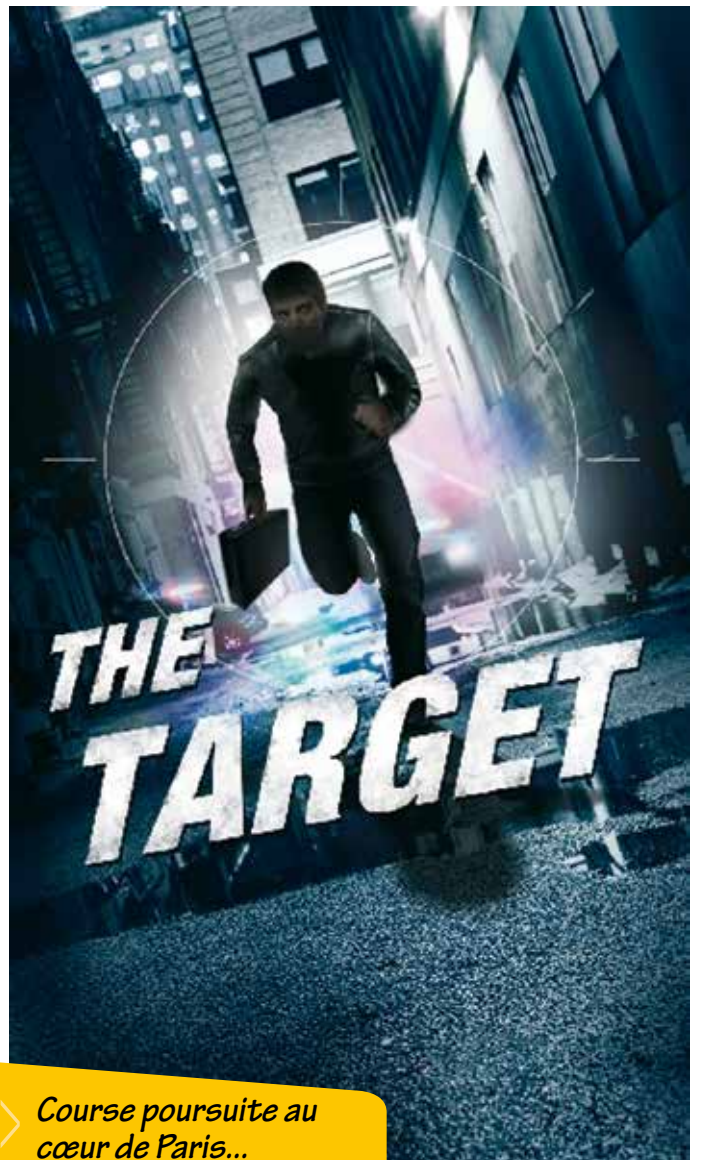
Course poursuite au cœur de Paris...